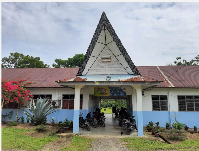
Gambar 1. Latar Depan SMP Negeri 3 Siempat Nempu

Penelitian ini berlatar di Sekolah Menengah Pertama (SMP) Negeri 3 Siempat Nempu yang beralamat di jl. Pendidikan no. 15 sihorbo, kecamatan Siempat Nempu, Kabupaten Dairi. Sekolah ini terletak jauh pusat kota Sidikalang dimana akses internet masih menjadi permasalahan utama pada saat proses daring pada tahun ajaran baru tahun 2020. Akses masuk jaringan internet masih kurang dengan sinyal yang lemah akan tetapi proses daring masih dapat terlaksanakan dan masih ada beberapa pendidik langsung secara door to door ke rumah untuk menjumpai peserta didik dalam interaksi belajar untuk memberikan arahan langsung untuk pengaplikasian M-Learning dan juga proses tahap pembelajaran. Mengingat hal tersebut pendidik harus bekerja lebih keras akan tetapi semangat pendidik juga diapresiasi oleh kepala sekolah dalam tindakan mencegah penularan Covid-19 dan mengantisipasi peserta didik yang tidak bisa melakukan pembelajaran online atau belum mengerti tentang metode M-Learning . Pada awal tahun 2021 pendidik di SMP Negeri 3 Siempat Nempu sepakat tidak lagi melakukan pembelajaran secara door to door mengingat adanya perkembangan Covid-19 yang meningkat. Aksi ini dihentikan atas kebijakan dari kepala sekolah agar pendidik tak lagi melakukan pembelajaran dengan metode door to door . Berikut merupakan latar depan SMP Negeri 3 Siempat Nempu.