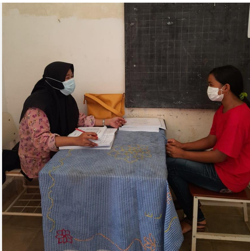
Gambar 1. Layanan Konseling Kelas IX Pada Saat Pembelajaran Online

Aktifitas ditinjau secara pengalaman konselor dengan memberikan pelayanan konseling kepada peserta didik baik itu sebelum pembelajaran online (Pembelajaran di sekolah dengan tatap muka) ataupun Pembelajaran Jarak Jauh (belajar dalam rumah). Pelayanan konseling ini dilakukan di sekolah pada jam 15.00 WIB dengan memberikan jadwal tertentu kepada setiap peserta didik dengan layanan individu. Pada pelayanan konseling di saat pandemi tetap melaksanakan dengan protokol kesehatan sesuai anjuran pemerintah.