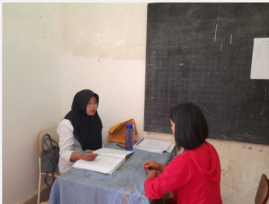
Gambar 2. Layanan Konseling Kelas VII SMP Negeri 3