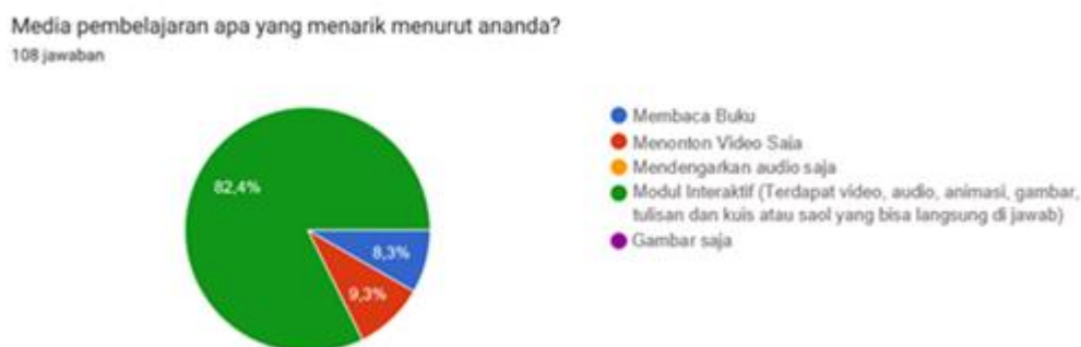
Gambar 1. Hasil analisis kebutuhan peserta didik

Berdasarkan hasil analisis kebutuhan pelajar yang dilakukan sebelum pengembangan produk, diperoleh informasi bahwa preferensi terhadap media pembelajaran sangat bervariasi. Sebanyak 8,3% pelajar memilih media pembelajaran berbasis teks (membaca saja), 9,3% menyukai pembelajaran melalui video, dan sebanyak 82,4% pelajar menyatakan lebih menyukai modul interaktif yang memuat kombinasi beberapa gaya belajar di dalamnya. Menariknya, tidak ada pelajar yang memilih media pembelajaran berbasis gambar saja. Temuan ini menunjukkan adanya perbedaan gaya belajar di antara pelajar, yakni gaya belajar visual (melalui gambar dan teks), auditori (melalui suara), serta audio-visual (kombinasi antara tampilan visual dan suara). Oleh karena itu, penyusunan media pembelajaran yang mampu mengakomodasi beragam gaya belajar menjadi penting guna menciptakan proses pembelajaran yang lebih efektif dan bermakna (El-Sabagh dkk,2024). Data ini secara visual dapat dilihat pada Gambar 1.