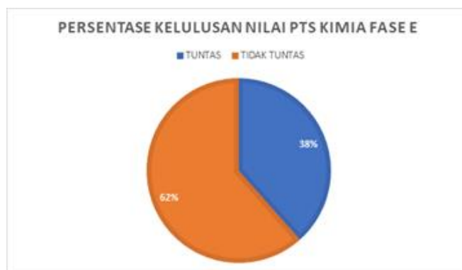
Gambar 2. Rekapitulasi hasil PTS Fase E SMAN 1 Laguboti

2. Salah satu faktor yang mempengaruhi hal ini adalah perbedaan tingkat pemahaman dan gaya belajar pelajar dan keterbatasan penggunaan bahan yang digunakan (Wahyuni dkk,2022).